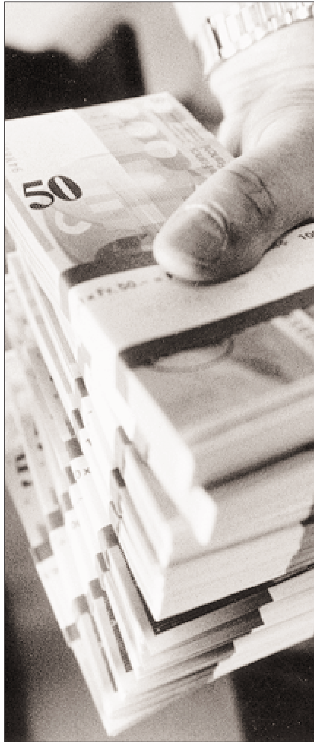
Wem gehört der Überschuss der Pensionskassen?

In ihrer Pressemitteilung orientierte die Konferenz der kantonalen BVG-Aufsichtsbehörden darüber, dass die BVG-Aufsichtsbehörden nicht für die Aktivierung von Forderungen gegenüber den Vorsorgeeinrichtungen in den Unternehmensabschlüssen zuständig seien. Ihr Tätigkeitsgebiet erstreckte sich über die Aufsicht über die Vorsorgeeinrichtungen und nicht über die Aufsicht der Arbeitgeber. Vielmehr sei die Aktivierung von Forderungen gegenüber einer Vorsorgeeinrichtung in